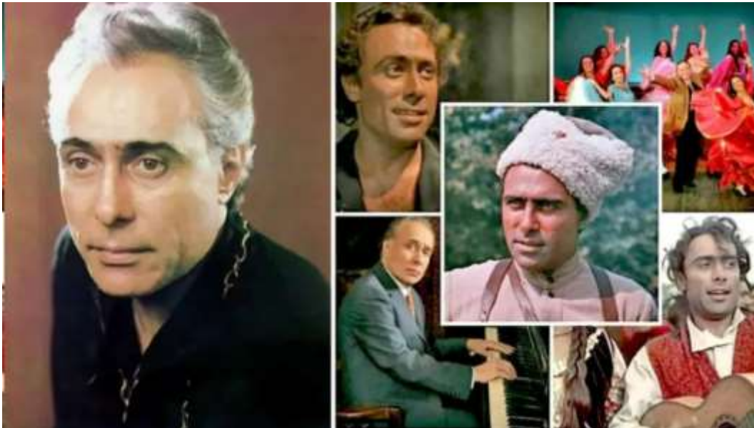
1939 – Эммануил Гедеонович Виторган , российский актёр.