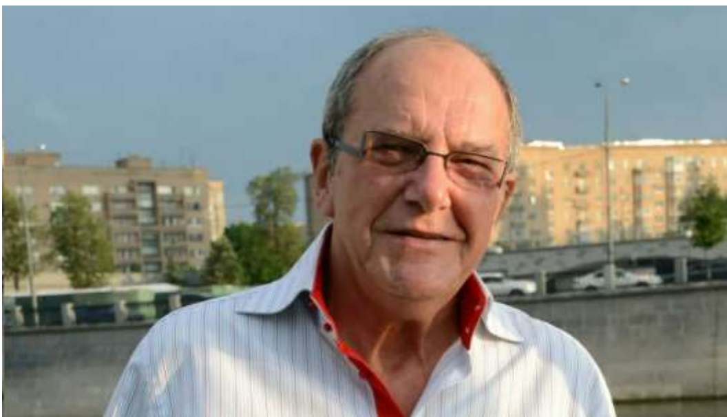
1948 – Жерар Депардьё , французский и российский актёр, ресторатор, винодел. Обладая талантом и харизмой, яркой и характерной внешностью, Депардьё востребован в кинематографе. Он играет широкий спектр ролей в фильмах различных жанров: комедиях, мелодрамах, исторических фильмах, классическом драматическом репертуаре... Наиболее известные картины с его участием, где он выступил и в комедийном, и в драматическом амплуа: «Мой папа — герой», «Невезучие», «Между ангелом и бесом», «Папаши», «Граф Монте-Кристо», «Луна в сточной канаве», «Астерикс и Обеликс против Цезаря», «Дантон», «Видок», «Наполеон», «Сирано де Бержерак», «Невезучие», «Распутин», «Лига мечты»... На сегодняшний день в фильмографии актёра более полутора сотен фильмов самых